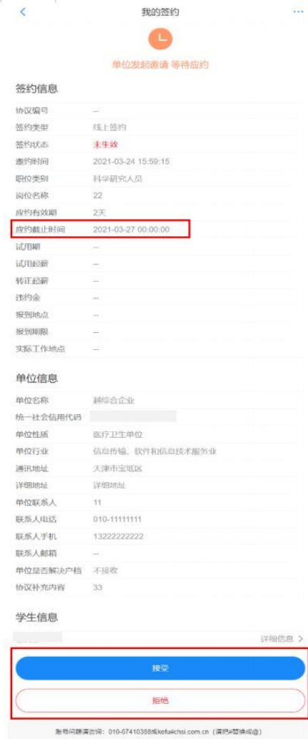
图 7 毕业生应约