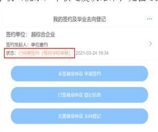
图8 学校(院系)签约审核