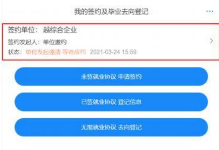
图 6 用人单位邀约