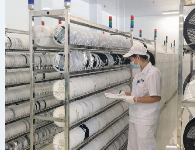
汽车零配件 & 电子元件