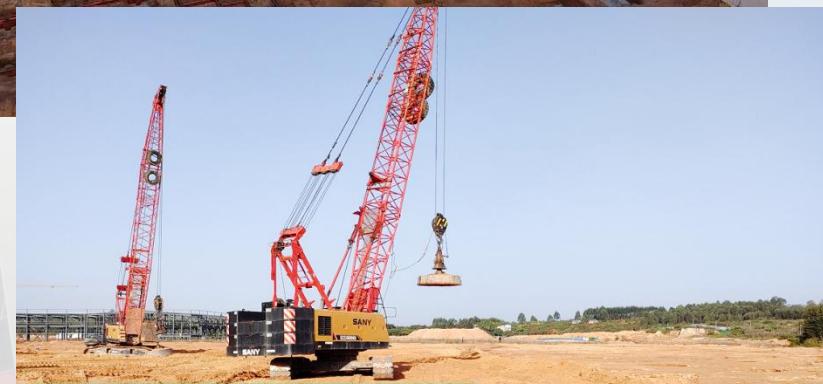
广东美时达粤东供应链中心

施工区域：施工现场 施工内容：满夯（QH1-8区，夯能1000KN.M） 拍摄时间：2022.12.21 08:50 建设单位：广东美时达粤东实业投资有限公司 施工单位：惠州市城乡建筑工程有限公司 设计单位：广东省轻纺建筑设计院有限公司 勘察单位：广东海业岩土工程有限公司